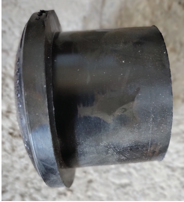
Figur 2. Gummi- gjennomføring