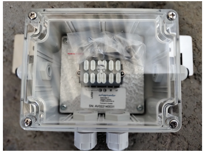
Figur 4. Koblingsboks som følger med UV-enheten monteres i underkant av teleskoplokkets laveste punkt.

NB! UV-lys er skadelig for hud og øyne, så hold UV-lampen avslått under alt arbeid.