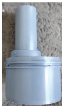
Figur 1. Medfølgende Ø110-50 overgang

UV-tankens utløp Ø110 ledes til egnet resipient.