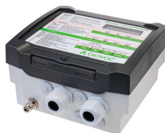
Biovac® pumpGuard for 1-fas