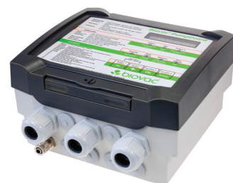
Biovac® pumpGuard for 3-fas