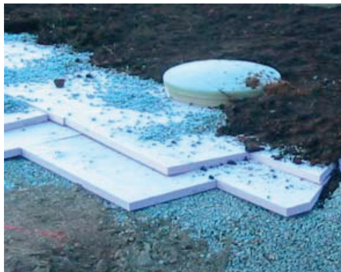
Frostsikring av tanker

I frostutsatte områder, og ved bruk av grunne grøfter, anbefales det også å legge varmekabel langs utløpsledningen og ut i utslippsgrøfta.